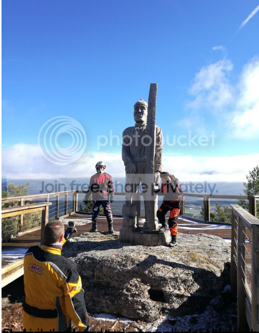
Estadua de un personaje de la zona, el Castiello de Caupazuta, desde donde se puede apreciar