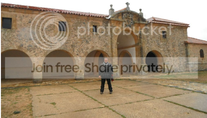
El día 12 de mayo, el grupo se reunió en la plaza de San Juan de los Rios para la salida hacia el castro de San Juan de los Rios.