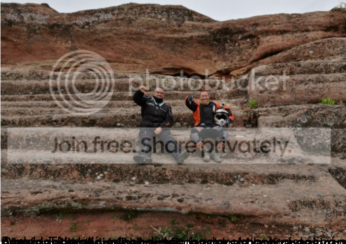
Después de haber terminado el tour, el grupo se fue a un restaurante para comer.