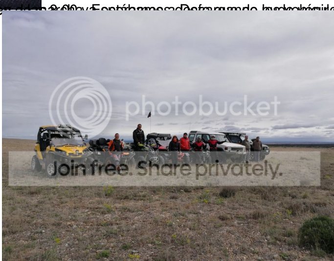
Foto 6181: Un grupo de personas con vehículos todoterreno en un terreno abierto.