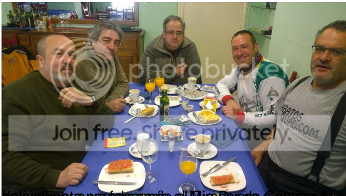
Restaurante en el camino al Mirador de Caupazuta desde donde se observan unas vistas del Urbión y