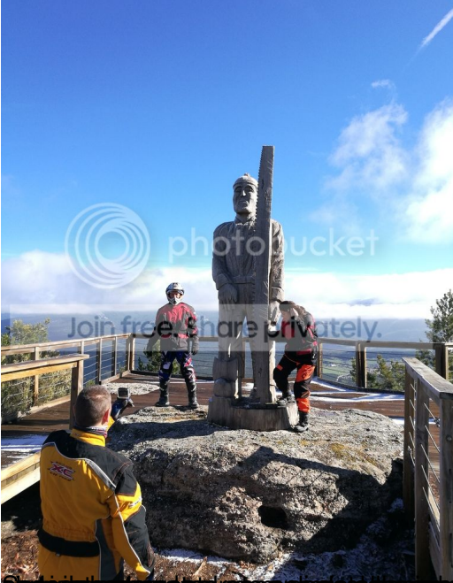
Estadua de don Juan de Guzman, el fundador de Guapasa, en el casco urbano de Guapasa. El casco urbano de Guapasa es muy bonito, pero