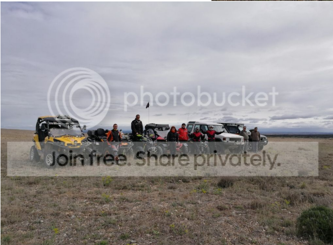
Foto 6132: Un grupo de personas con vehículos todoterreno en un terreno abierto.