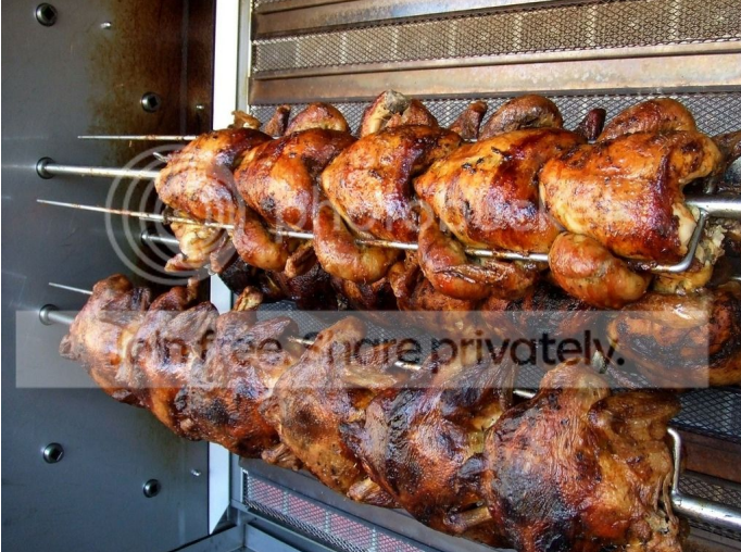
El precio de un pollo asado puede oscilar entre 10 y 15 euros, dependiendo de las condiciones de uso.