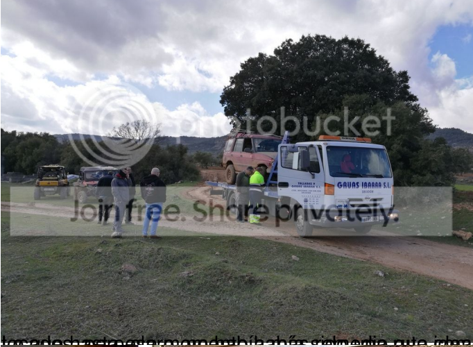
El alquiler de un vehículo de este tipo puede oscilar entre 100 y 200 euros al día, dependiendo de las condiciones de uso.