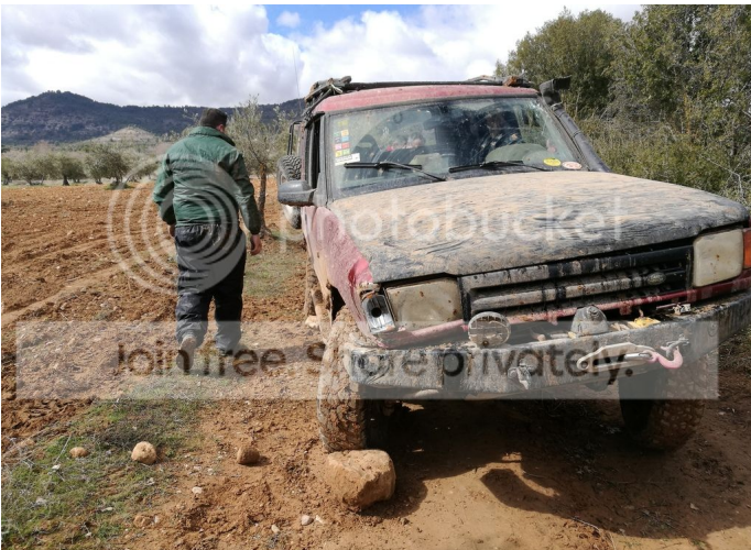
con un motor de 2000 cc y un tanque de combustible de 100 litros. El precio de un vehículo de este tipo oscila entre 10.000 y 15.000 euros.