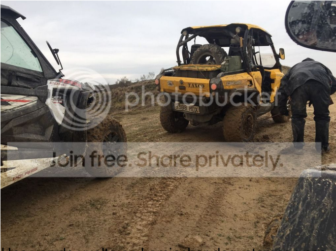
Una vez de vuelta en Lominger degustamos unas ricas viandas para recuperar fuerzas