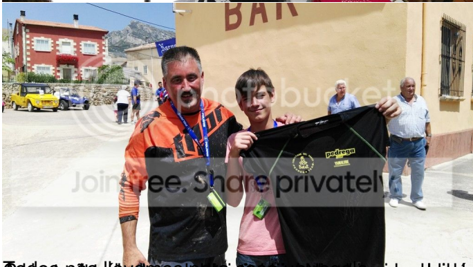
Los participantes en la tarde de domingo, se les entregó un casco y una camiseta para cada participante.