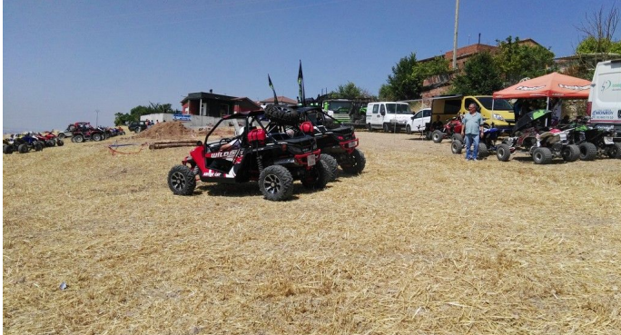
Una gran mañana de competición, los participantes se preparan para el inicio de la competición