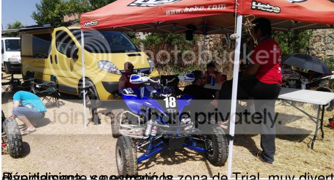
El punto de partida es en esta zona de Trial, muy divertida con un balancín, troncos, una gran poza