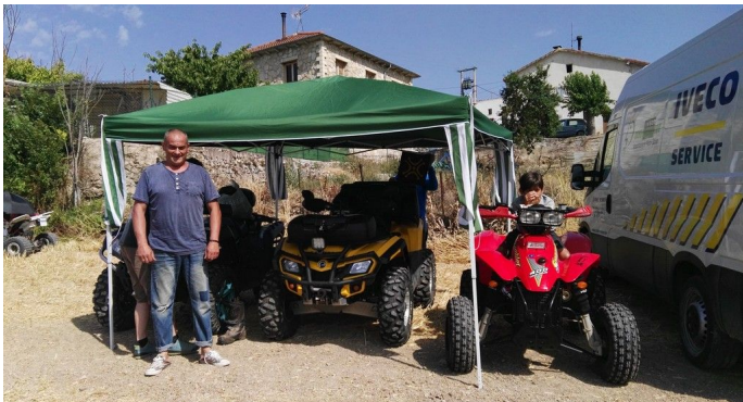
Gente conocida, amigos, los saludos de rigor, y a pasear por la zona y sacar algunas fotos