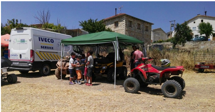
Amisateo finalizado dimiñente de mañalos hubo para todos los participantes, cascos, camisas,