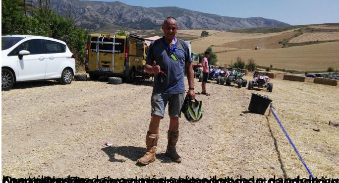
Arrancando el primer día de competición, los participantes se preparan para el inicio de la competición