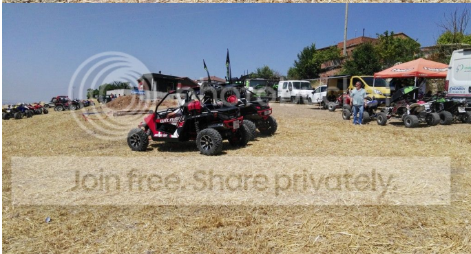
Una gran zona de Trial, muy divertida con un balancín, troncos, una gran poza