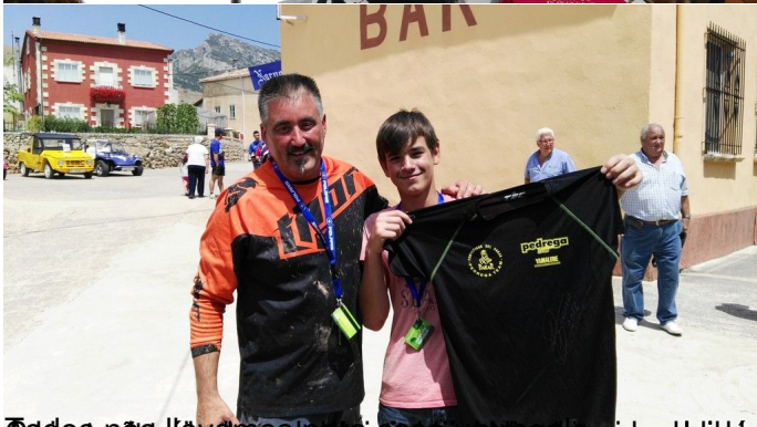
Todo más de una hora, para un día, pasando por el día de mañana, se celebró la actividad.