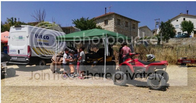
Amisateo final de la tarde de domingo con los participantes, hubo para todos los participantes, cascos, camisas,