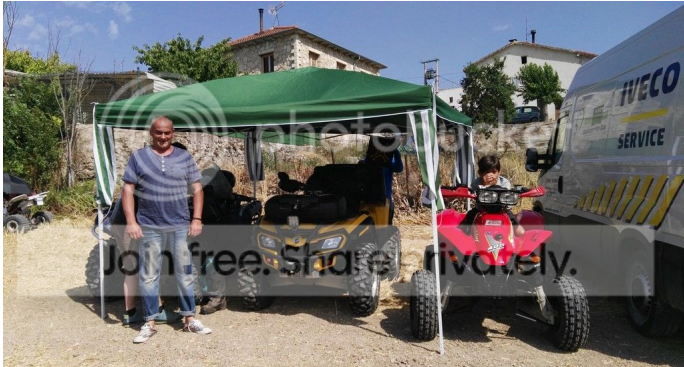
Gente conocida, amigos, los saludos de rigor, y a pasear por la zona y sacar algunas fotos