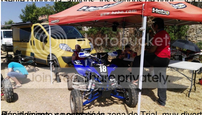
El punto de partida es en esta zona de Trial, muy divertida con un balancín, troncos, una gran poza