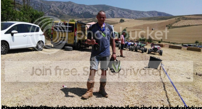
Arranque de la carrera en la zona de Trial, muy divertida con un balancín, troncos, una gran poza