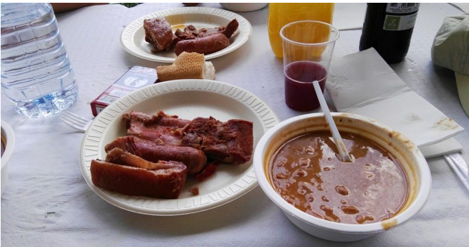
Detenido en la retención hasta a mi madre para un último momento para marchar a casa... pero con la panza llena y