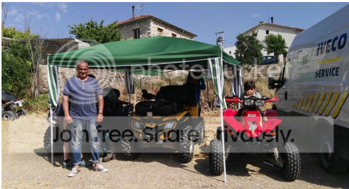
Gente conocida, amigos, los saludos de rigor, y a pasear por la zona y sacar algunas fotos