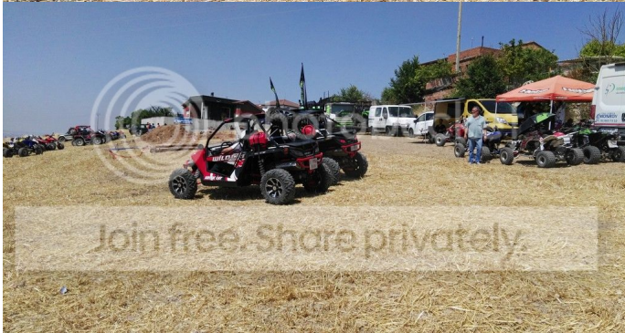
Una gran zona de trial, muy divertida con un balancín, troncos, una gran poza y una gran zona de trial, muy divertida con un balancín, troncos, una gran poza