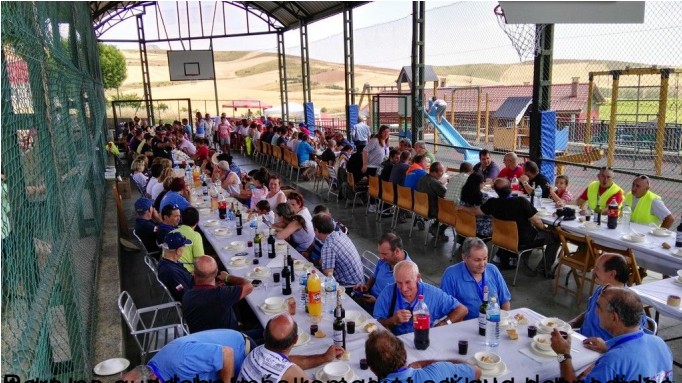
En un momento de la comida se escuchó un ruido fuerte y se empezó a correr, pero no se sabe qué fue.