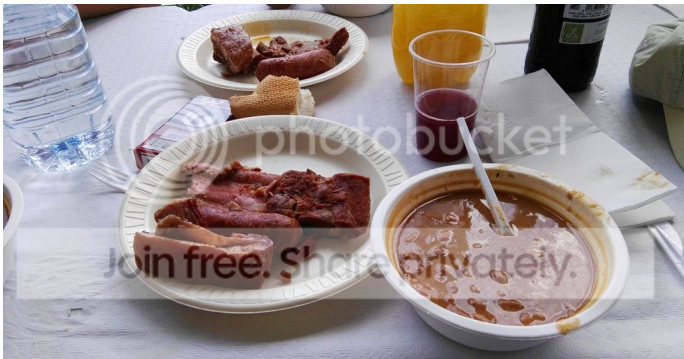
Después de la comida me iba a mi casa a descansar un tiempo pero me empezaron a machar a casa... pero con la panza llena y