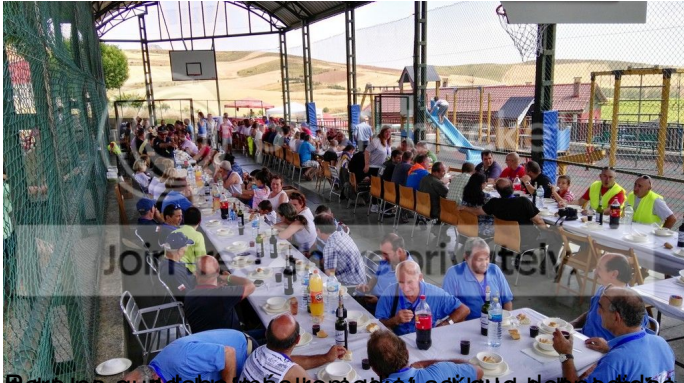
Después de la comida me iba a mi casa a descansar un tiempo pero me empezaron a machar a casa... pero con la panza llena y