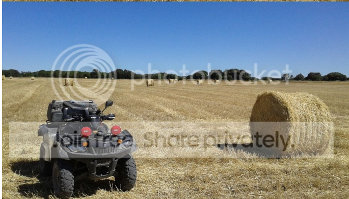
Hicieron terminando el trabajo del día. El día es alivia

mi calor y prosigo la ruta a través del pinar resinero