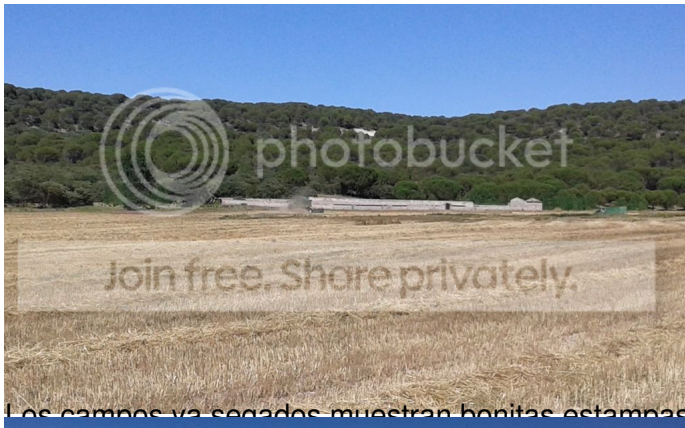
Los campos ya secados muestran bonitas estampas.