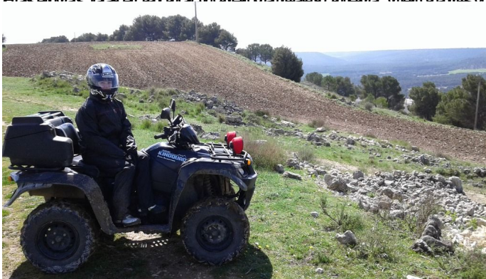
Los campos amarillean con la colza y el olor es increíble.

...hasta que espectacularos mas bonitos, en el se puede