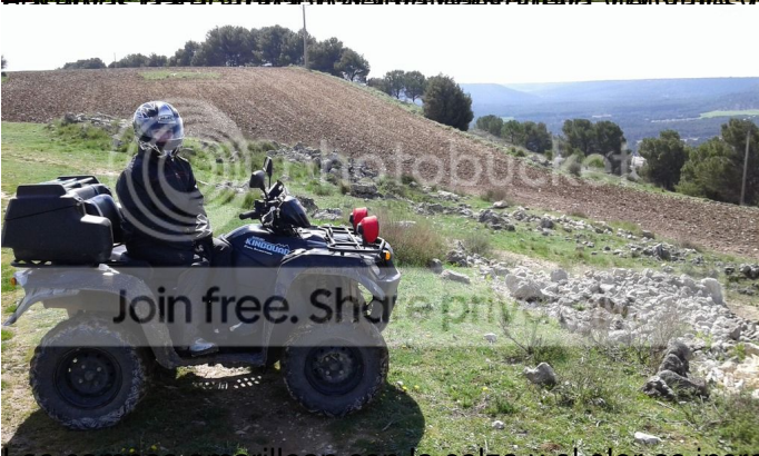
Los campos amarillean con la colza y el olor es increíble.

...hasta que se vean los campos mas bonitos, en el se puede