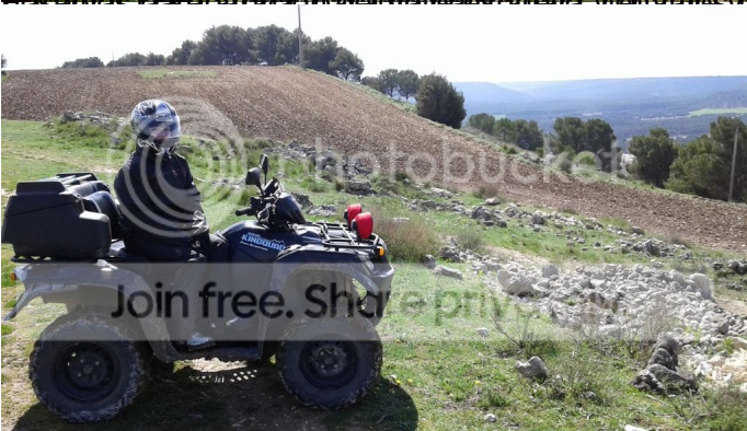
Los campos amarillean con la colza y el olor es increíble.

hasta que espectacularos mas bonitos, en el se puede