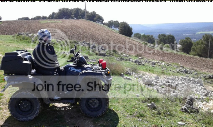
Los campos amarillean con la colza y el olor es increíble.

...hasta que se vean los campos mas bonitos, en el se puede