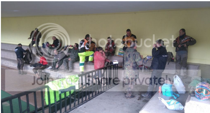
Y llegamos a la boca de la bestia 6900m de tunel completamente a oscuras