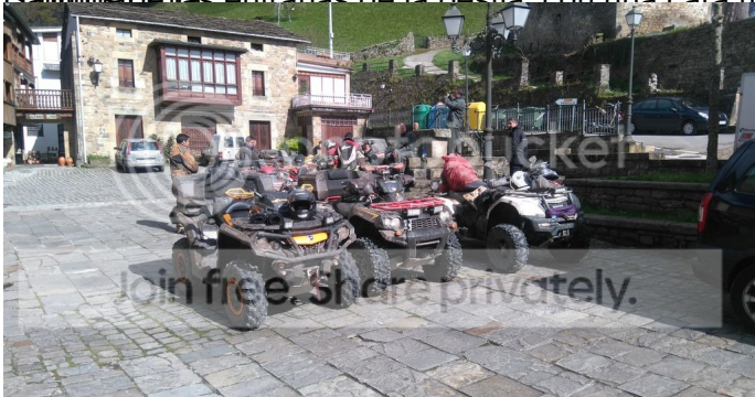
Almuerzo en un restaurante tradicional, con una vista espectacular por un hayal, a través de un camino estrecho,