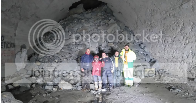
Continuando las entrañas de la bestia, con una cara mezcla de alivio y satisfacción, dispuestos a