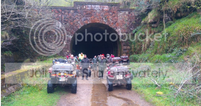
El ambiente es frío y húmedo, pero los chicos se divierten al salir y al entrar, se sacan fotos de ellos, algunos se sacan fotos de ellos, algunos se sacan fotos de ellos