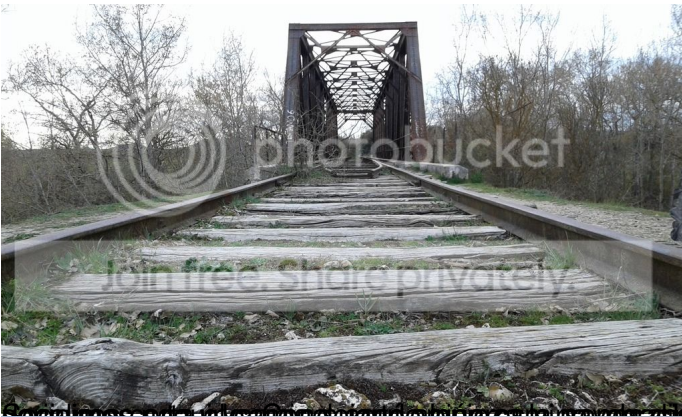
Logia la que es un puente de madera que se encuentra en una