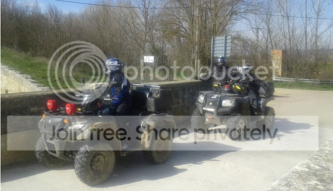
No le puede más corta caminos rápidos y no por ello menos interesantes, Aquí os dejo la foto