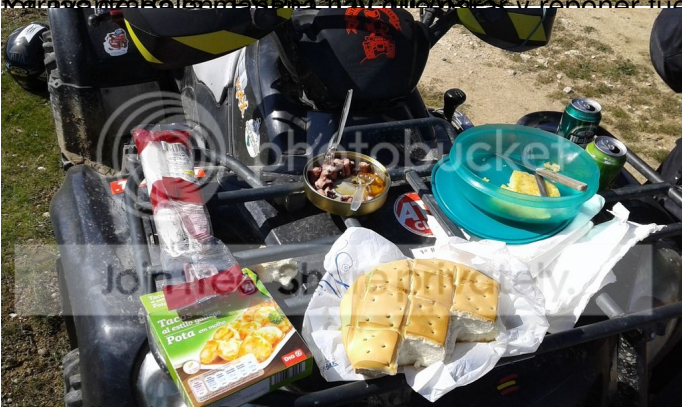
Municipio de Bolson, EBD, CEA, Chile, ADF y reponer fuerzas, un succulento almuerzo con las ya típicas