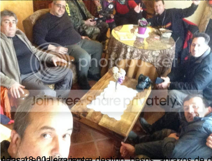
A las 18:00 llevo a los clientes de destino, beso a los brazos de despedida y cada mochuelo a su olivo.....a