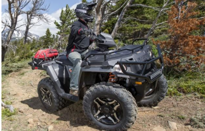
EL SPORTSMAN TOURING 570 SP, con las mismas llantas y neumaticos que el 570 SP, en color rojo