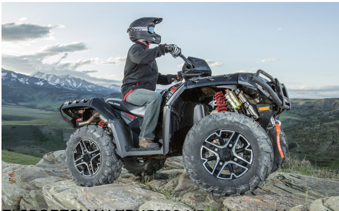
EL SPORTSMAN XP1000 con el nuevo asamblea de potencia Polaris Pursuit Camo