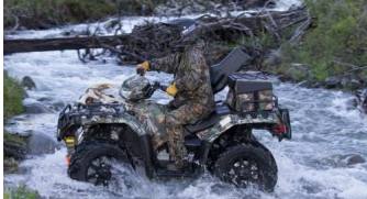
EL SPORTSMAN 570 SP con llantas de aluminio de 14" y neumaticos MAXXIS de 26", en color