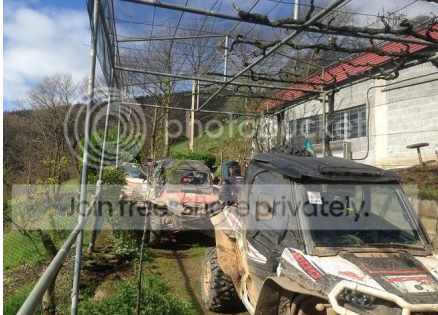
El café en el campamento (esta es la familia de Carlos