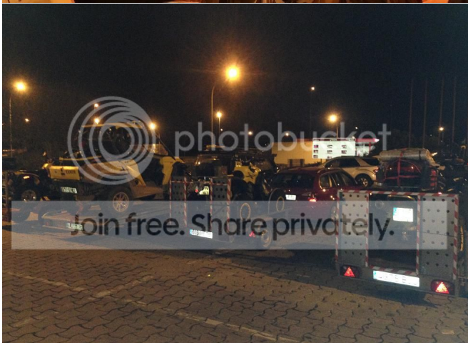
Alfregamos todos lo que nos quedaba de las cosas ATV y más si a las 10 de la noche me dio la gana los Todo