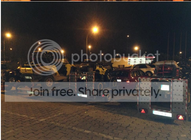
Alfregamos todos lo que nos quedaba de las ATV's para el campamento y a los Todo