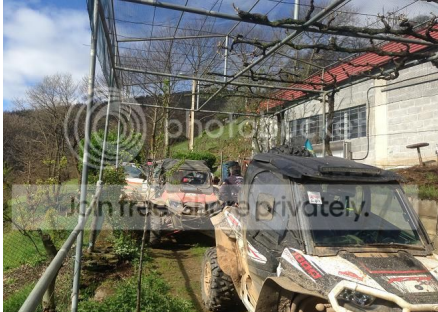
El café con leche de los chicos (de la base) de la familia de los Carlos