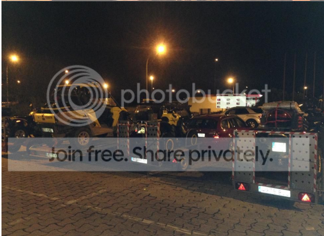
Alfregamos todos lo que nos quedaba de las ATV's para el campamento y a los Todo