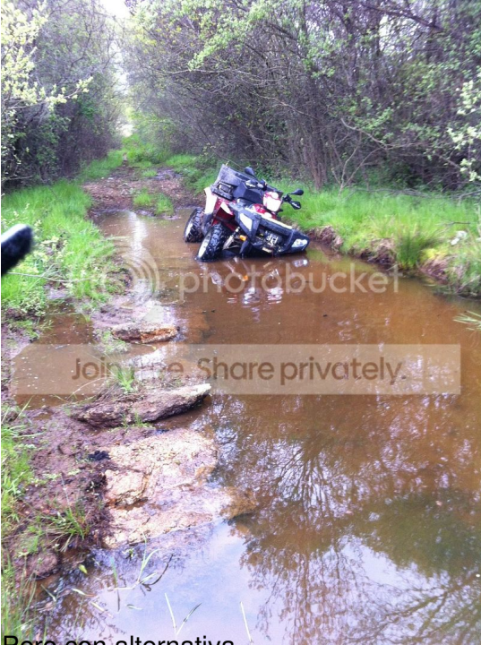
Pero con alternativa 😊