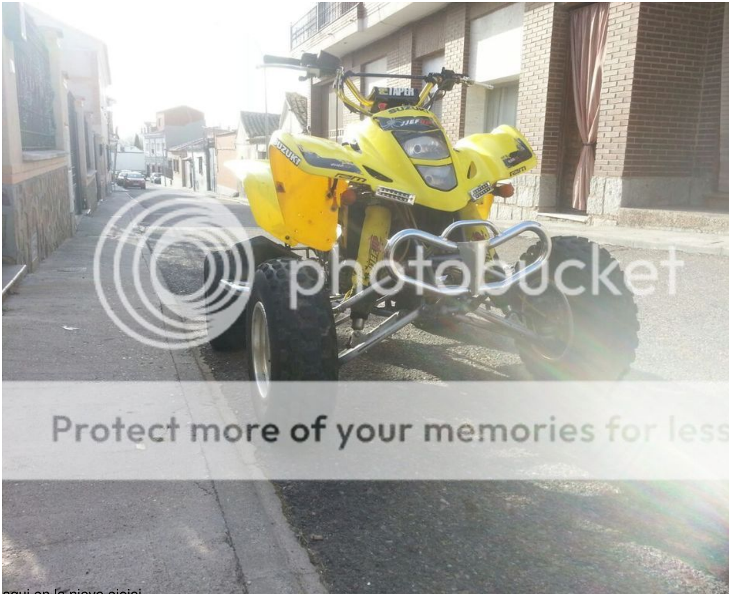
aqui en la nieve ejejej