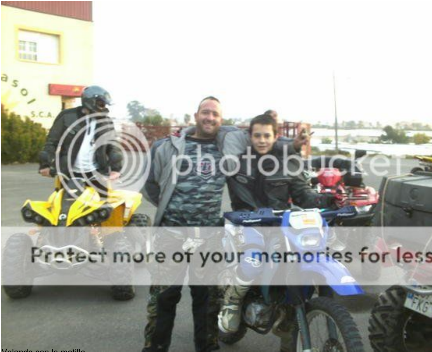
Volando con la motillo 🍷