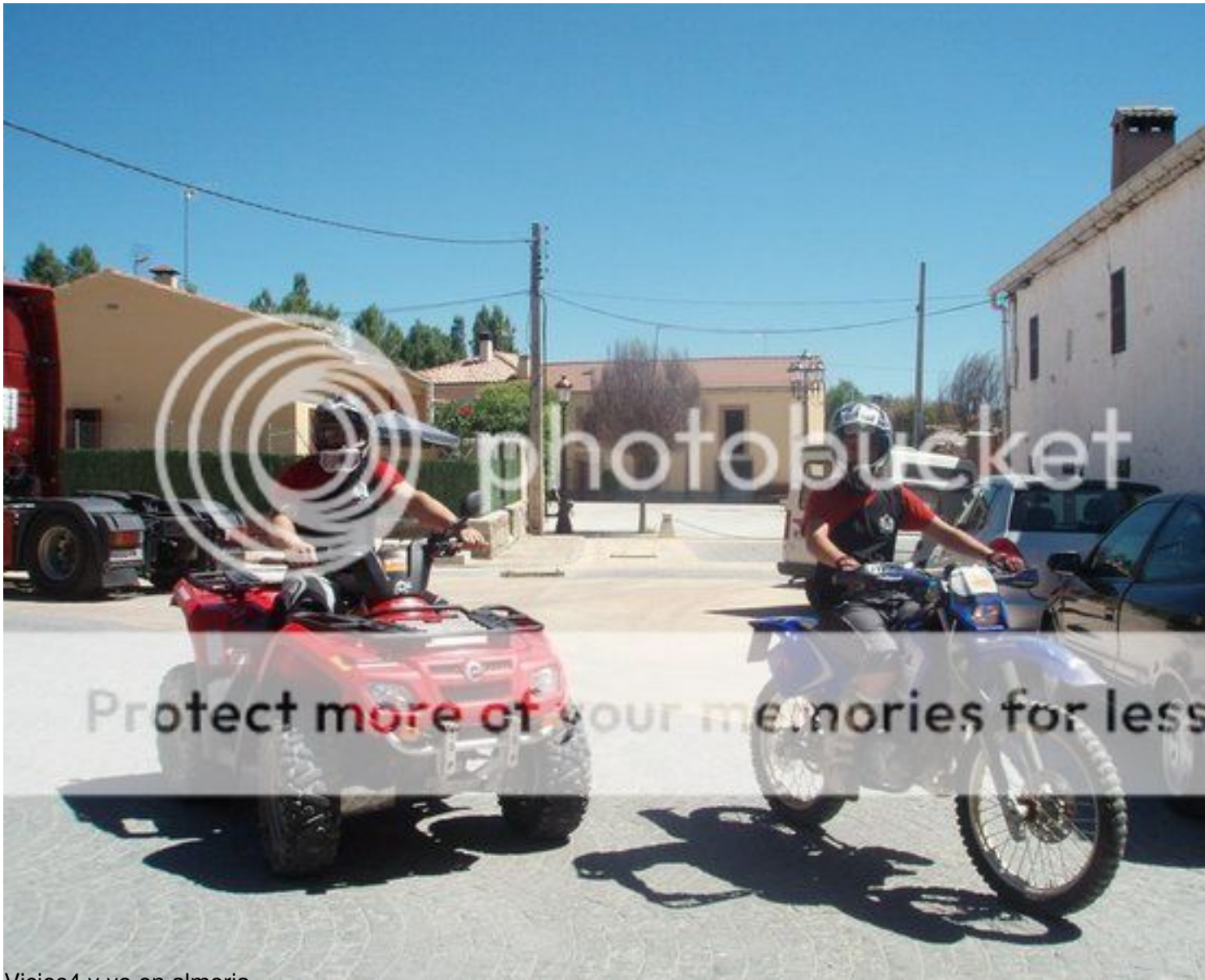
Vicios4 y yo en almeria